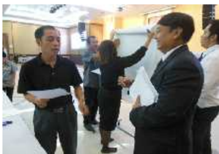
กลุ่มที่ ๑