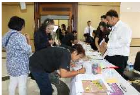
ตำบลตลาดขวัญ