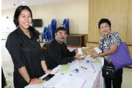
ตำบลท่าทราย