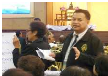
กลุ่มที่ ๓