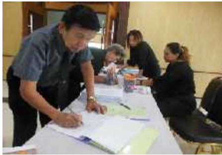
ตำบลบางกระสอบ