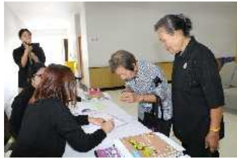
ตำบลสวนใหญ่