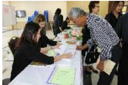
ตำบลบางเขน